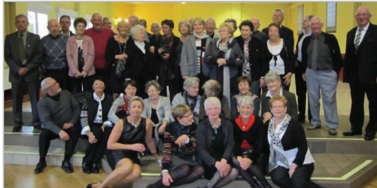
Le groupe d'amis fidèles se retrouve toujours avec un grand plaisir.

Après s'être rendus au monument aux morts pour célébrer le 95 e anniversaire de l'armistice de 1918, suivi de la cérémonie religieuse, les anciens d'AFN se sont retrouvés à la salle des fêtes, avec leurs épouses, pour leur tradi-