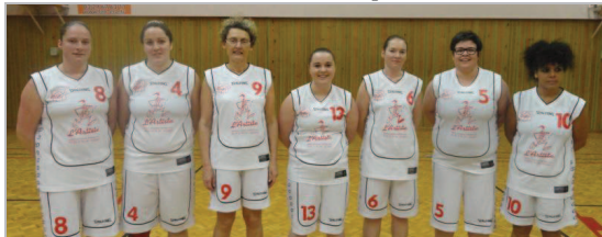
Grâce à l'arrivée de trois nouvelles joueuses, l'équipe des féminines a pu de nouveau s'engager dans la compétition.

Après avoir joué en excellence régionale et en prématonale, les joueuses de l'équipe féminine viennent de réintégrer le championnat départemental pour cette nouvelle saison.